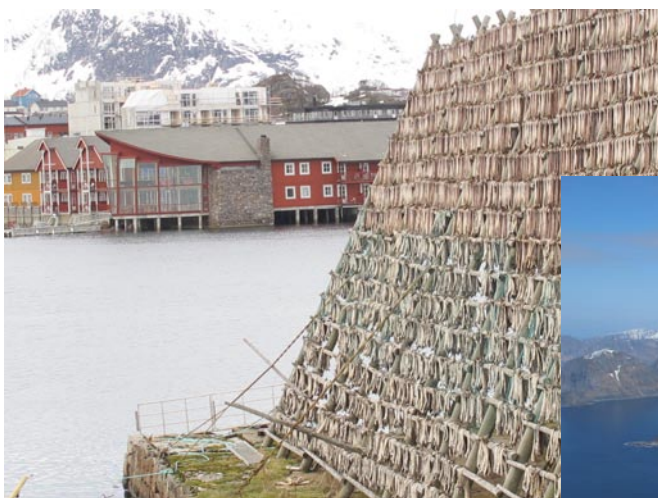
Unser Rica Hotel in Svolvær

Für Fragen aller Art stehen wir Dir selbstverständlich zur Verfügung!