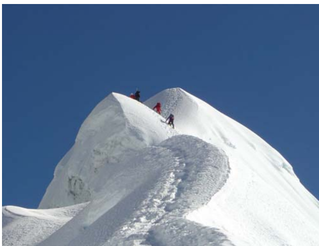
Am Gipfelaufschwung des Islandpeak

Norbert Joos wird die Tour als Euer Nepalkenner selber leiten und Euch die Geschichten seiner Achttausenderbesteigungen nahe bringen.